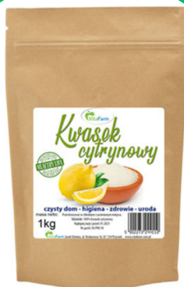
Kwas cytrynowy 1 kg -VitaFarm