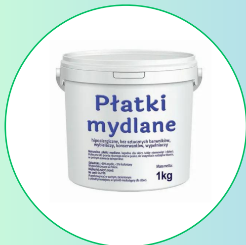
Płatki mydlane 1kg- Vitafarm