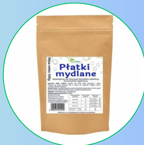
Płatki mydlane hipoalergiczne doypack 500g- Vitafarm