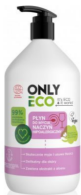
Hipoalergiczny płyn do mycia naczyń 1l- Onlyeco