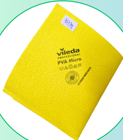
Ścierka do szyb, luster Vileda pva micro 35x38 żółta