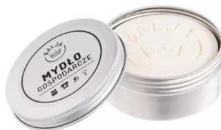
Mydło gospodarcze w puszce 110g Balja