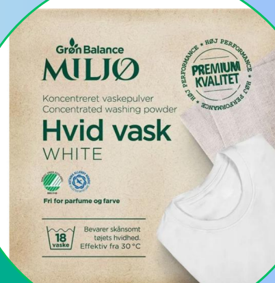
Proszek do prania białych ubrań (koncentrat) 785g- Gron balance