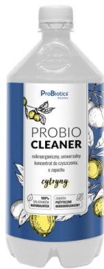
Probio cleaner 950 ml koncentrat do sprzątania cytrynowy - Probiotics