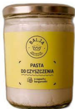
Uniwersalna pasta do czyszczenia bergamotka 450g- Balja