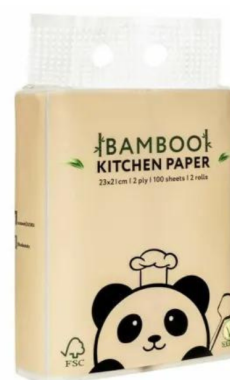
Ręcznik kuchenny bambusowy 2 rolki -Zuzii