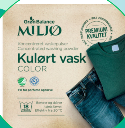
Proszek do prania kolorowych ubrań (koncentrat) 785g- Gron balance