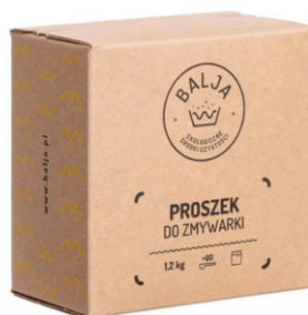
Proszek do zmywarki ,60 zmywań 1,2kg-Bajla