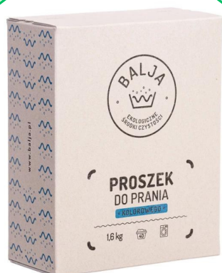
Proszek do prania kolorowego 1,6 kg - Bajla