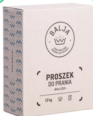
Proszek do prania białego 1,6 kg -Bajla