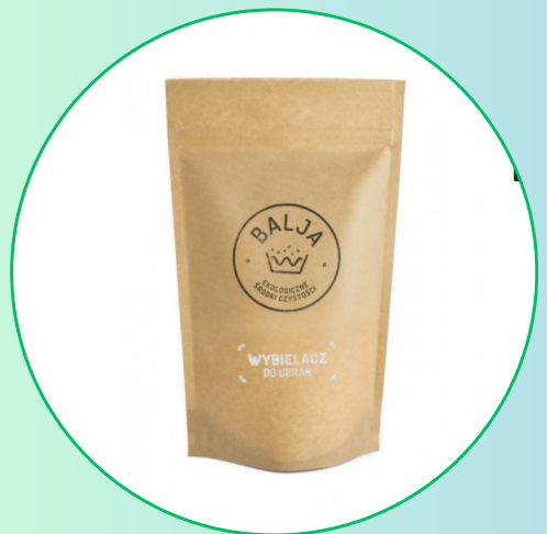
Wybielacz do ubrań 600g - Bajla