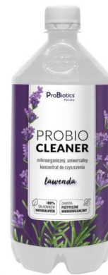
Probio cleaner 950 ml koncentrat do sprzątania lawendowy - Probiotics