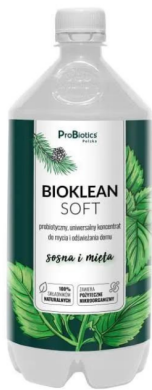
Bioklean soft mikroorganiczny płyn do mycia sosna i mięta 1000ml- Probiotics