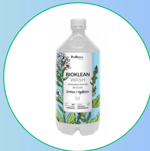
Bioklean wash mikroorganizmy płyn do prania z ekstraktami mydlnicy oraz kmosy 1000ml- probiotics