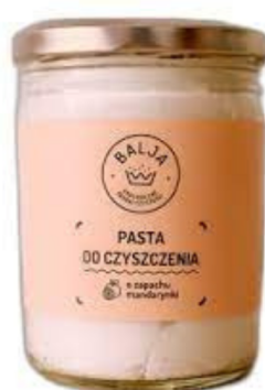
Uniwersalna pasta do czyszczenia mandarynka 450g- Balja