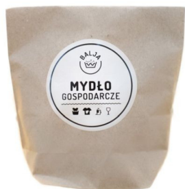
Mydło gospodarcze w papierowej torebce 110g Balja